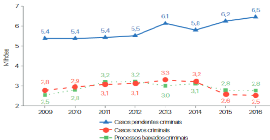
Figura 1 - Correlação entre casos novos e pendentes criminais (excluídas as execuções penais) 8